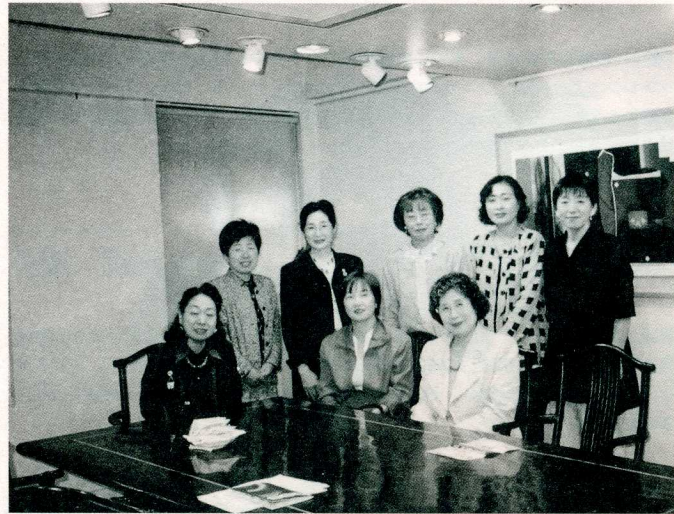
ギャラリー「もず」にて

12:30より「ギャラリーもず」(伏見ビル内)での例会。土曜日の昼間の例会と言う事もあり、出席者は12名。伏見ビルは大正時代に建てられた洋風建築で、大正デモクラシー