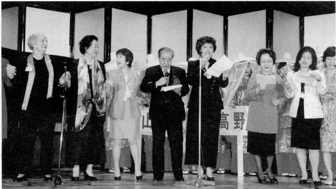
AMフィナーレ、今日の日はさようなら、上を向いて歩こう

文化(茶道、花道、書道、日舞、折り紙、百人 一首(かるた)、日本料理)等をカリキュラムを 組んで幼稚園から高校までの全校生徒にデモン ストレーションと実習を行いました。茶道と日 本料理は私が担当しました。とても好評で、更に一ヶ月父兄の為 に夜の部を作った事でした。それから三十年以上経ち、現在では 日本はとても良く知られた国になり、オランダでも「まき寿司」 がポピュラーになる程だと聞きます。帰国してからは、娘ともど も、カルチャーショックと日本の大きな変化の中で、ピッツバ ーグ大学の洋上大学の方々の日本上陸の時ホームステイ・ビジット のお手伝いをして参りました。「常に何らかの形で社会の為 に・・・」をモットーとして行きたいと思っています。今後共ど うぞよろしくお願ひします。