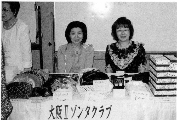
大阪Ⅱゾンタクラブ

最後に、私達のメンバーが「よし！買おう」と言って、お買い上げ下さった事、ありがとうございました。けれど品物はまだ沢山あります。これからもどんどん買ってくださいね。なんだかだんだん大阪商人になってきたように思います。最後になりましたが、グッズ委員の方々、早朝から本当にありがとうございました。皆様の手際の良さに感服した一日でした。