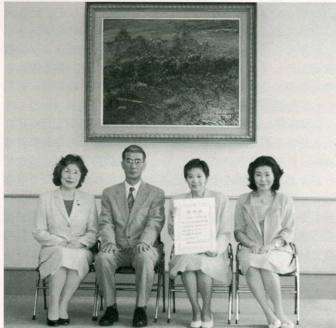
大阪府庁にて、女性基金への寄付の感謝状をいただく

私達クラブも、大阪の地で、健気に精一杯大阪の美しい黄色いバラを咲かせたいと思います。どうぞよろしくお願い致します。