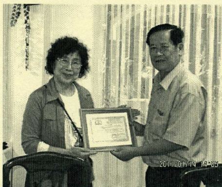
レ・フィンさんから感謝状をいただく

皆で食卓を囲み Zonta クラブの話もしました。是非みなさんでベンチェへきて下さい、そうすればどんなにいいでしょう、といわれましました。そして今後も支援をお願ひしますとのことでした。