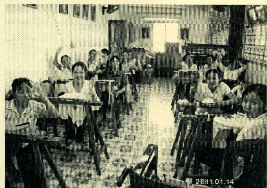
刺繍をしている生徒達