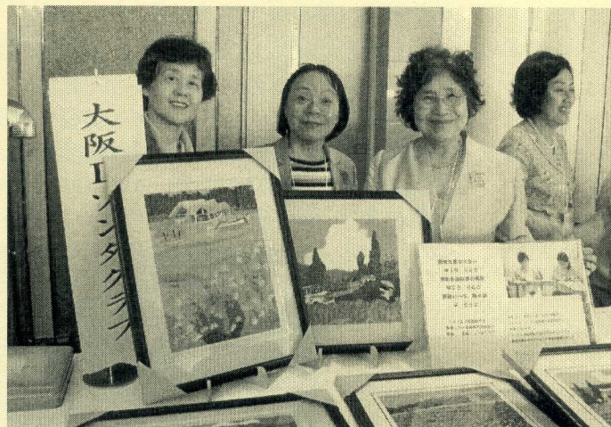
ゾンタストアにて