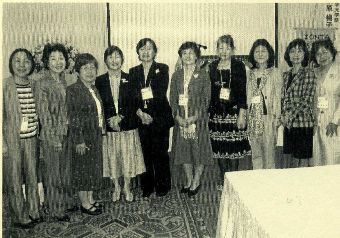
大阪Ⅱからの参加者

私の知る限り、多くのゾンシャンはそれなりにゾンタを楽しんで満足しており、だからこそゾンタは続いており、日本のゾンタは創立50周年を迎えるのです。