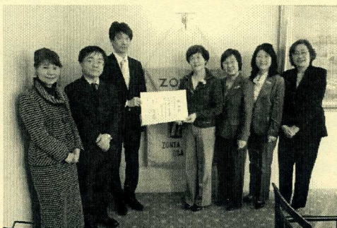
大阪市花と緑のまちづくり推進基金への寄付

大阪市花と緑のまちづくり推進基金として 多額の会員も御寄附賜り 御芳名誠にありがとうございました 三三 深く感謝の意を表します 平成二十一年一月二日 大阪市長 平松邦夫 国際ゾンタ二十六地区 大阪Ⅱ ゾンタクラブ 殿