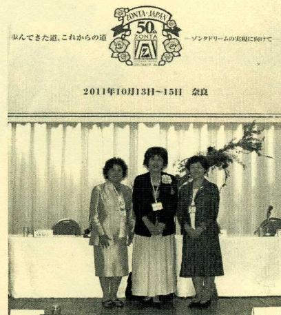
地区大会大会場にて