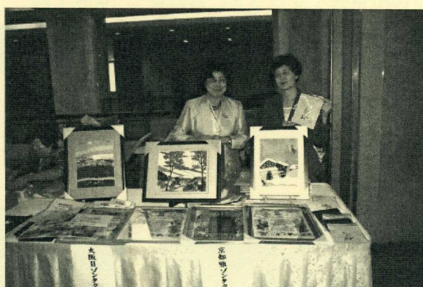
ベンチェ職業支援先で作られた手刺繍の額、ポーチ、Tシャツをゾンタストアで販売し、人気を呼びました。