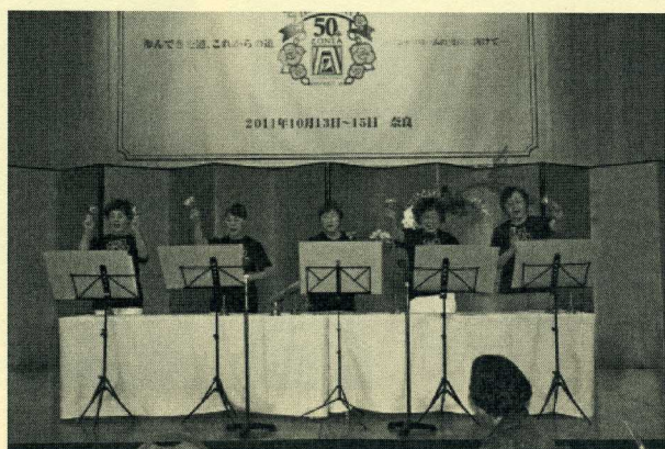
当クラブのハンドベル・ガールたちにより「エーデルワイス」「よるこびの歌」「上を向いて歩こう」の3曲が演奏され、パーティ会場を大いに盛り上げました。