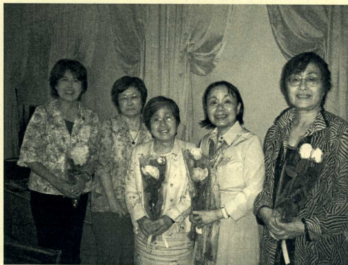
誕生月の会員に黄色いバラのプレゼント