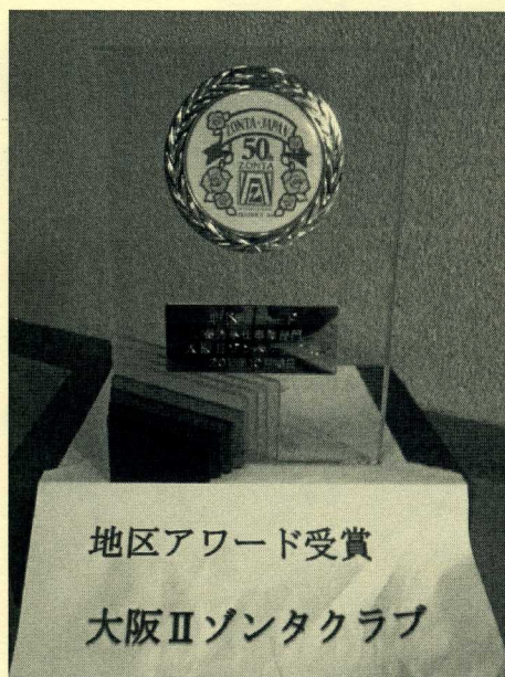
ベトナム・ベンチェの障がいを持つ女子への10年間にわたる職業訓練支援と自立援助にたいし、当クラブが優秀奉仕事業部門の「地区アワード賞」を受賞しました。